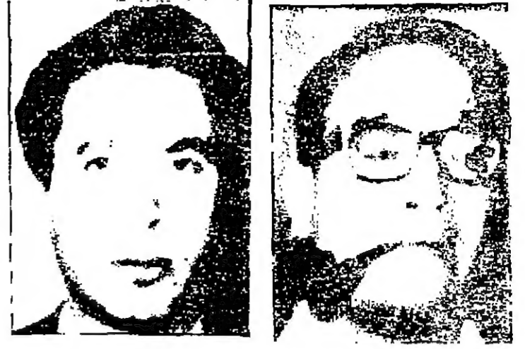
السيدان المرمان الميمان بالجمهورية العربية المتحدة وعلى محمود علسي